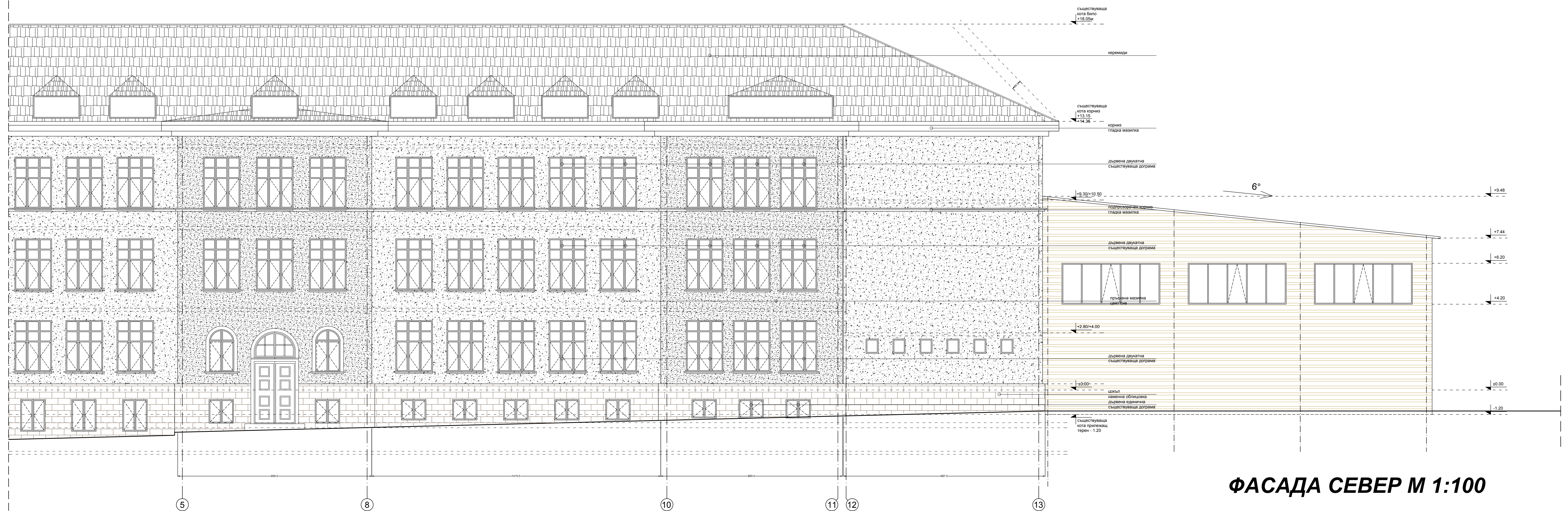
ФАСАДА СЕВЕР М 1:100